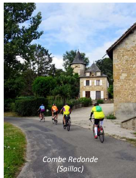
Combe Redonde (Saillac)

Une autre vedette est né dans cette commune, le sympathique Maurice Biraud, il naquit en 1922 et mourut en 1982 à l'âge de 60 ans. Sa tombe se trouve dans le cimetière du village. Nous traversons le village à pied en nous rendant sous la halle qui abrite également un four à pain.