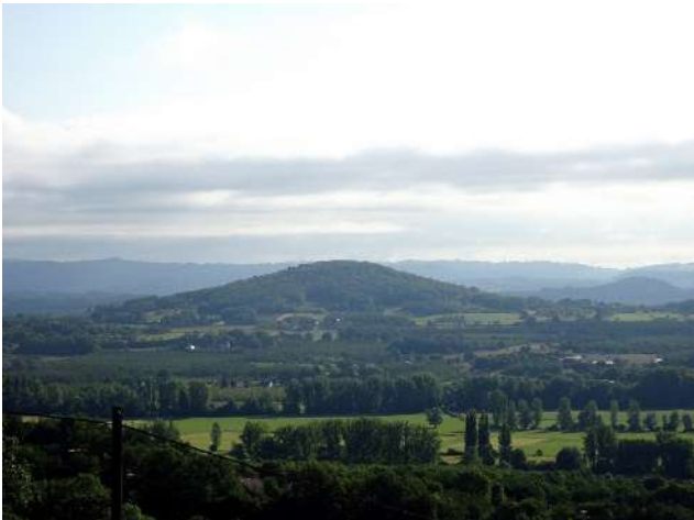
Le Puy du Toul domine Condat

Il est 8h30 largement passé quand nous démarrons pour le petit hameau de Loupchat où se trouve un manoir du XIV ème et bien entendu il se trouvait sur les terres des vicomtes de Turenne ! Nous continuons et grimpons sur une crête qui nous permet d'apercevoir la vallée de la Tourmente.