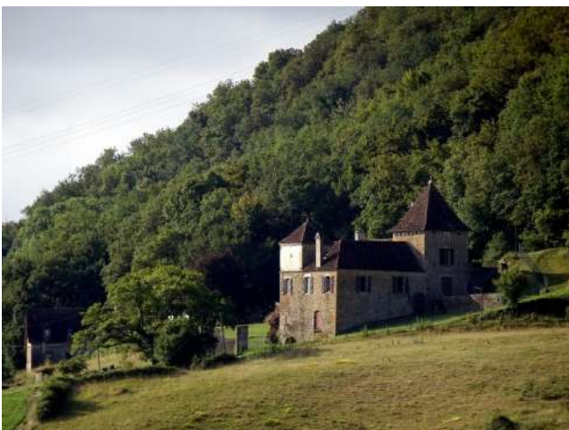
Le Château de Marbot